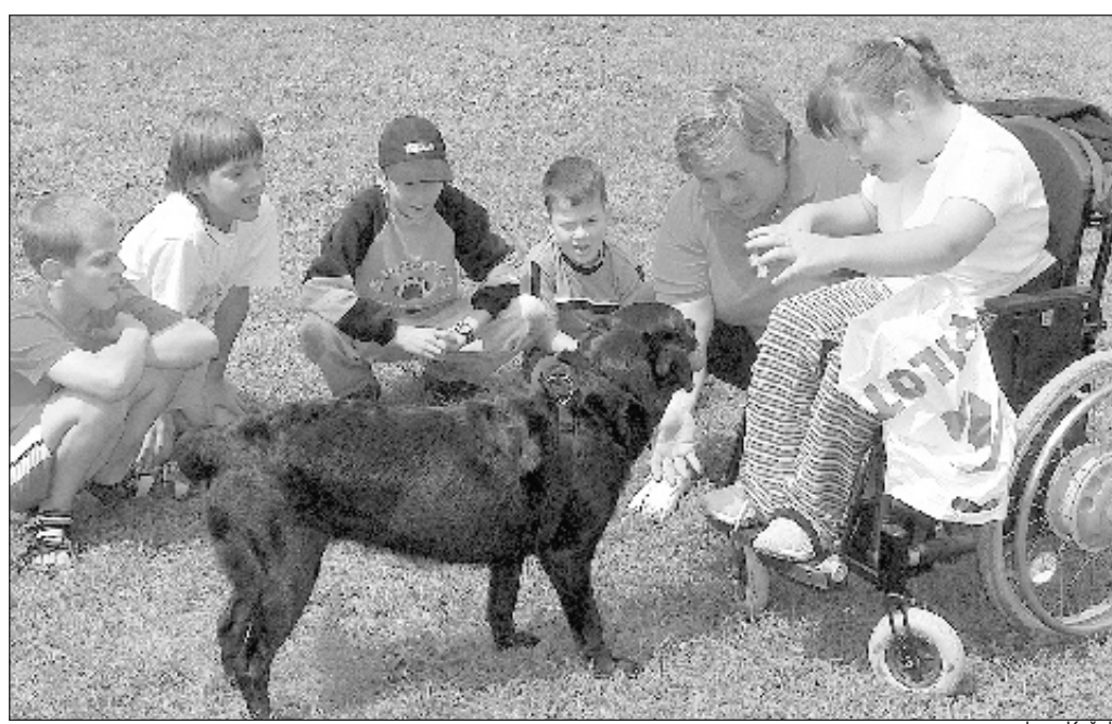
“Še meni, še meni,” so se za pozornost psice borili otroci.